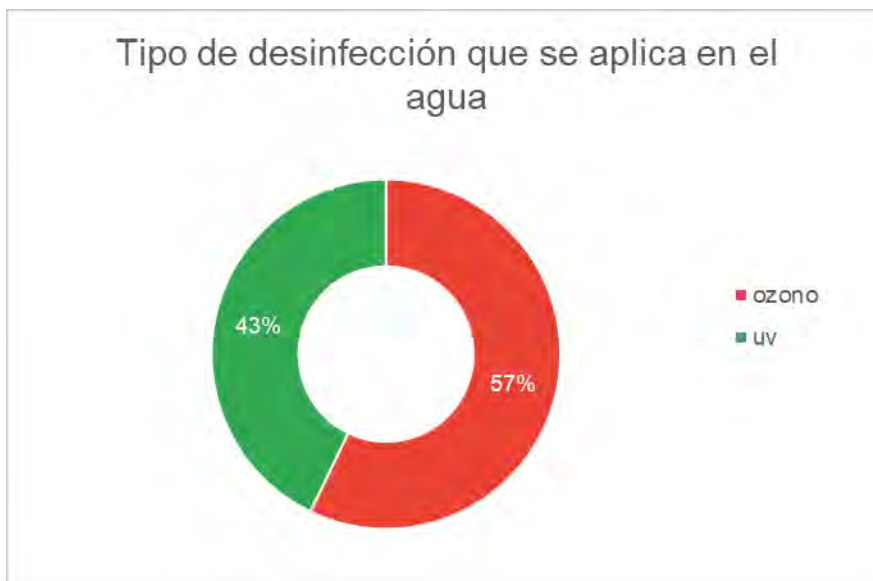
Figura 2. Tipo de desinfección que se realiza al agua al momento del transporte.